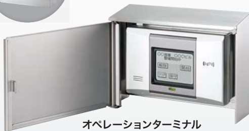
オペレーションターミナル OT-P1/OT-P1FM