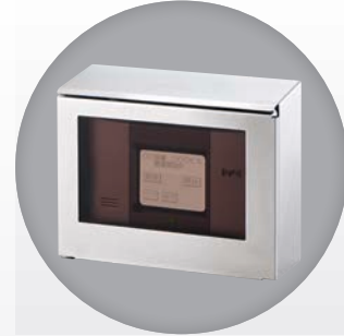
オペレーションターミナル OT-P1/OT-P1FM