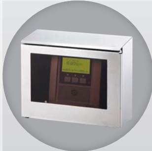
オペレーションターミナル OT-404