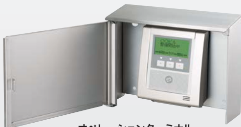
オペレーションターミナル OT-404