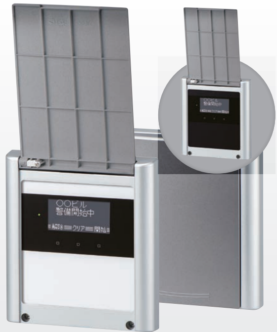
オペレーションターミナル OT-P3/OT-P3FM