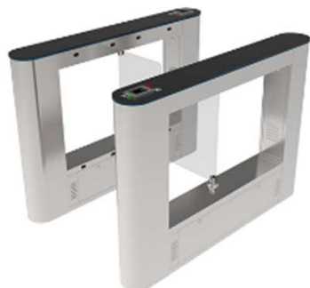
SBTL6000 1通路双方向 スイングバリアゲート