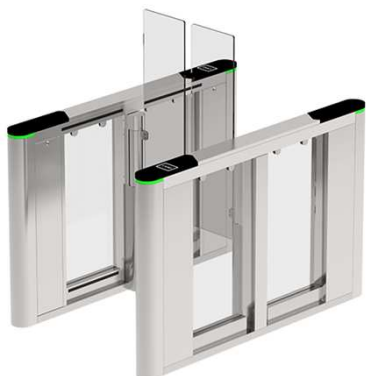
SBTL8000 1通路双方向 スイングバリアゲート