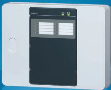
接点出力装置 DO-P1/DO-P1SW (写真DO-P1)